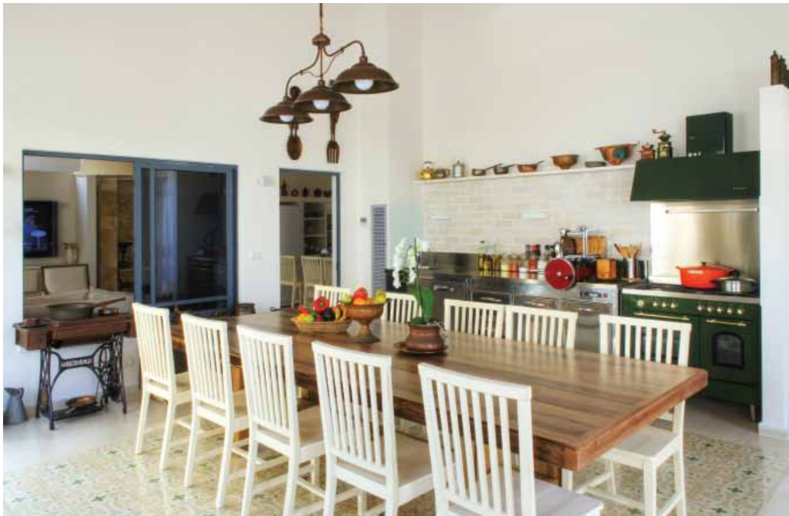
מאת חדווה אלמוז / עיצוב פנים אמיר גולן

אחד מארבעה אחים פנה לעולם האבטחה, אף שתמיד שאף לעסוק באדריכלות ובעיצוב. מקרה כאוב ובלי צפוי גרם לו להגשים את חלומו